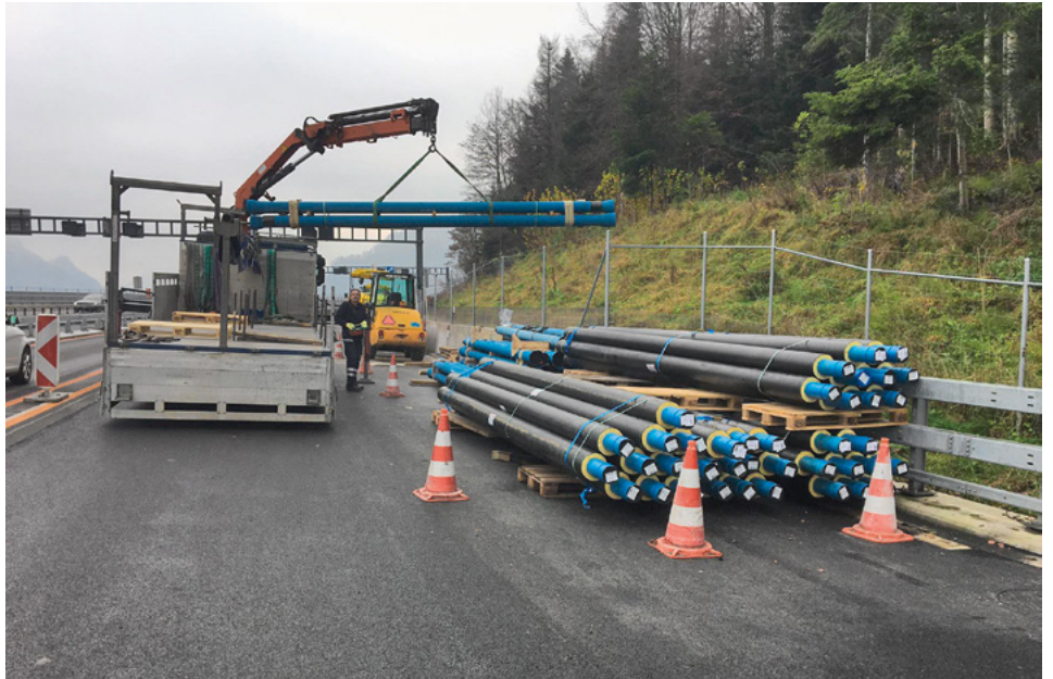
Die isolierten Gussrohre werden an der A2 angeliefert.

Im offenen Tunnelbereich wurde daher die Hydrantenleitung auf einer Länge von rund 720 Metern neu verlegt. Dank einer Auswinkelung von bis zu fünf Grad pro Muffe mit unserer montagefreundlichen BLS-Verbindung konnte auf der ganzen Länge auf zusätzliche Formstückbögen verzichtet werden. Wegen der teilweise nur minimalen Überdeckung beschloss die Bauherrschaft, die Rohre zusätzlich vor Frost zu schützen. Deshalb wurden die Gussrohre in der Nennweite DN 125 aus dem Hause Hagenbucher bereits komplett isoliert bis vor das Portal Nord geliefert. Die ortsansässige Verlegerfirma Blätter AG verlegte die Rohre anschliessend innert kürzester Zeit in das parallel