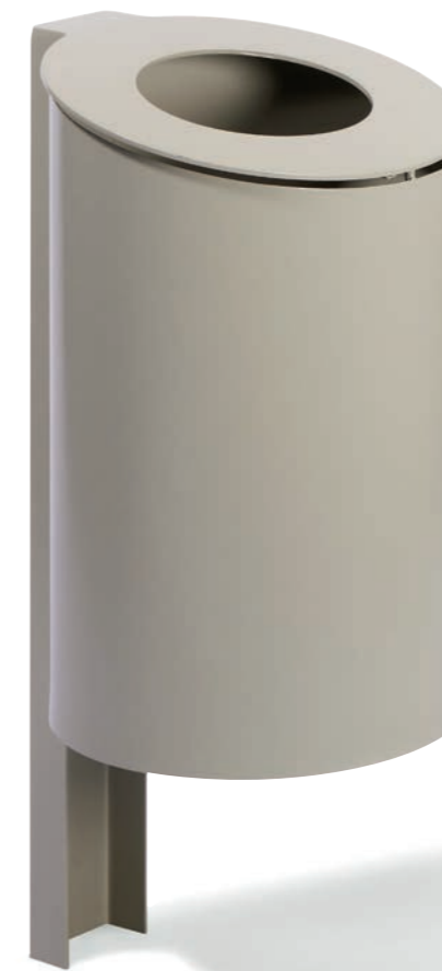
Abbildung zeigt Sonderfarbe BRIGHT GREY mit ovalem Drahtkorbeinsatz verzinkt.

Behälter aus Stahlblech, feuerverzinkt. Optional mit Farbbeschichtung. Standardfarbe DB 703, anthrazit-eisenglimmer.