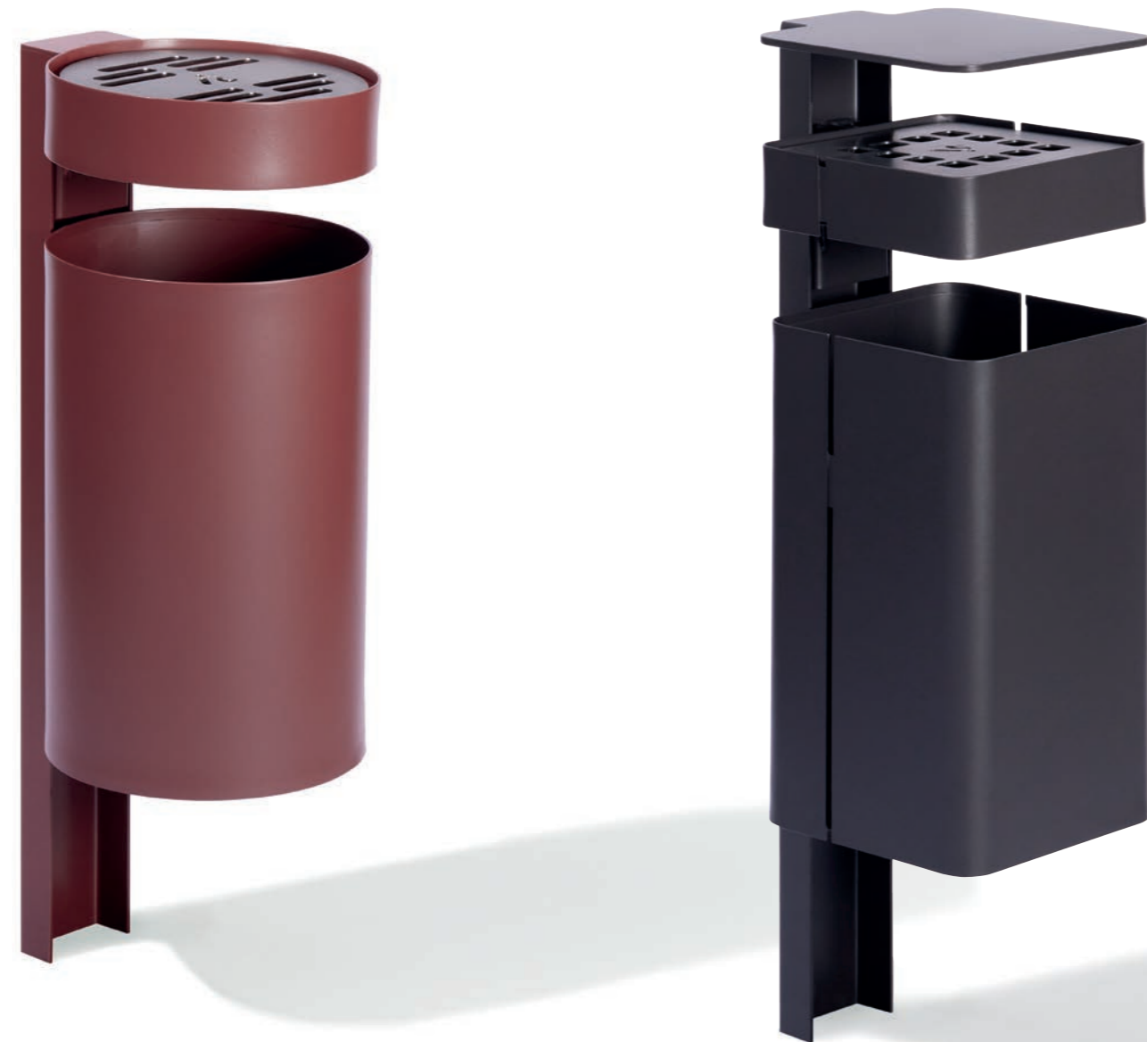
Abbildung zeigt Sonderfarbe BERRY.

Behälter aus Stahlblech, feuerverzinkt. Optional mit Farbbeschichtung. Ascherblech aus Edelstahl. Standardfarbe DB 703, anthrazit-eisenglimmer.